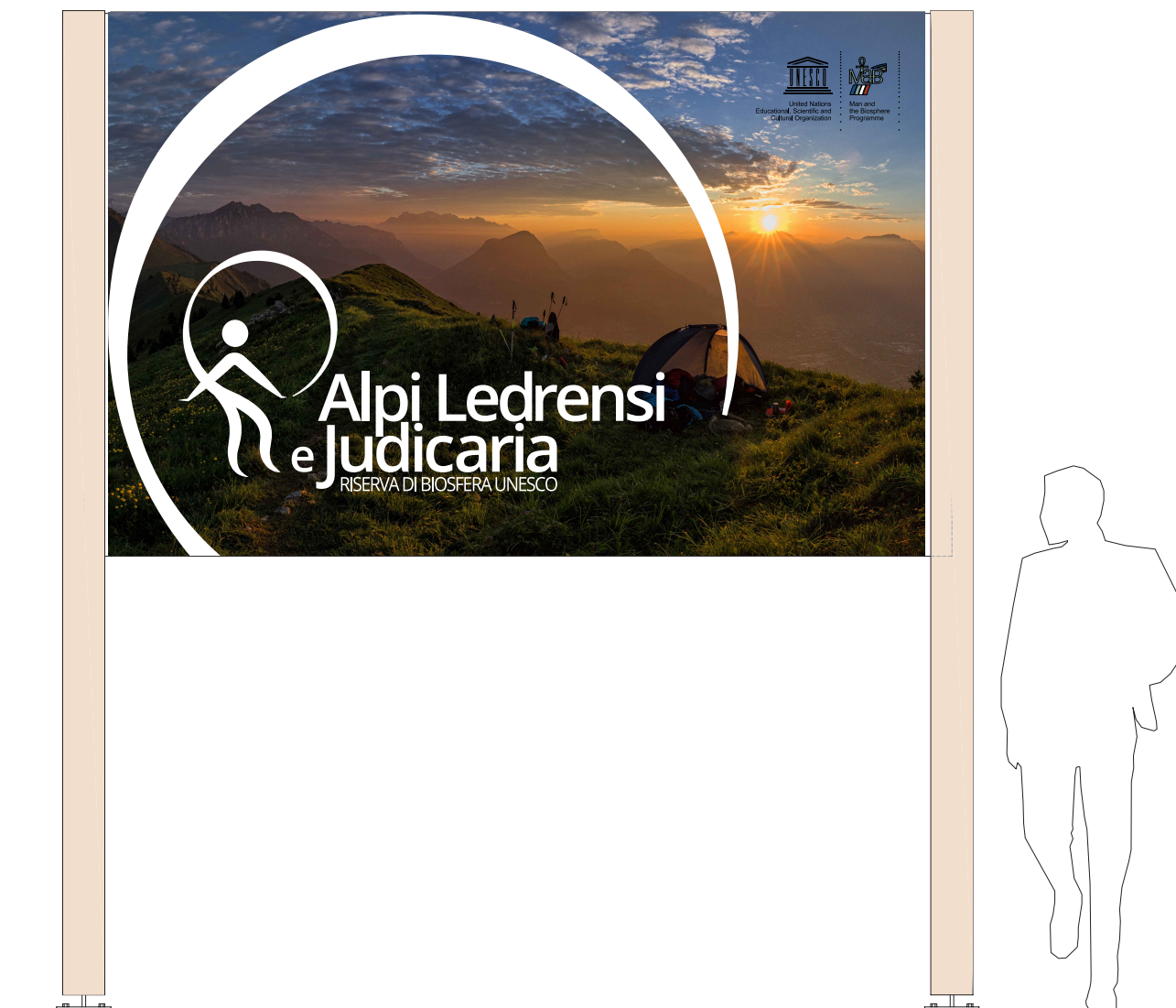
Portale in legno vista frontale scala 1:20