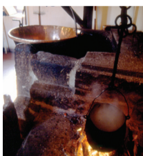
La trasformazione del latte in formaggio, antica arte ancora viva in queste valli.

"Agostini" in Val d'Ambez ed "XII Apostoli" sopra la Val d'Algone, a quelli panoramici sul Garda: il "San Pietro" sul Monte Calino, sopra Tenno ed il "Pernici" posto alla Bocca di Trat, in Valle di Ledro.