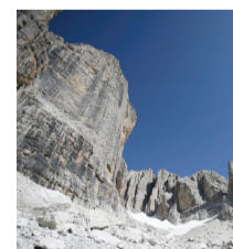
Le maestose vette delle Dolomiti di Brenta che sovrastano la val d'Ambiez

stretti a castelli, antichi baluardi di difesa e di amministrazione del territorio, fra cui Castel Stenico, un tempo proprietà del Principe Vescovo di Trento ed oggi adibito a museo.